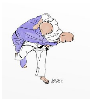
HARAI GOSHI (amigo traicionero)