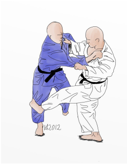
HIZA GURUMA (escoba alta)