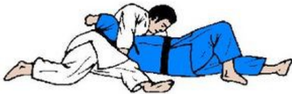
USHIRO KESA GATAME (2º sillón)