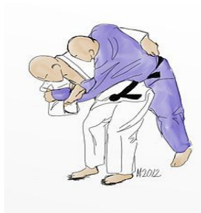
O GOSHI (saco de patatas)