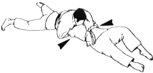
KUZURE KAMI SHIO GATAME (2ª excavadora)