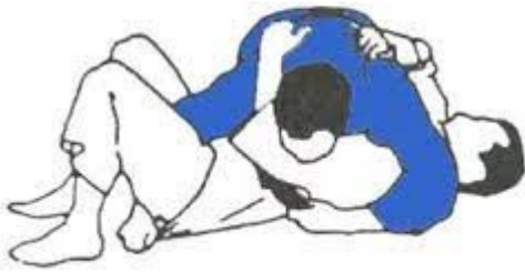
KUZURE YOKO SHIO GATAME (2ª cruz)