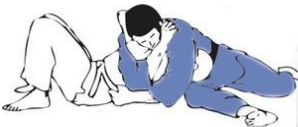
MAKURA KESA GATAME (almohada)