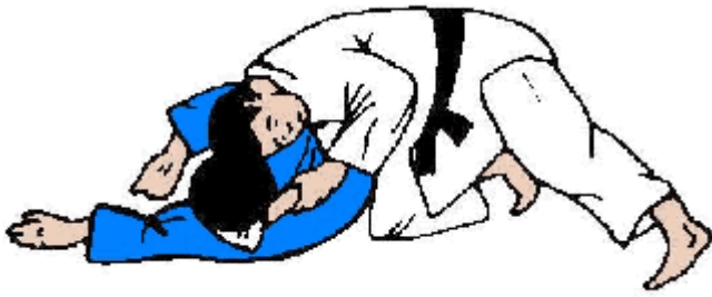
KATA GATAME (antena)