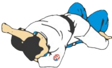
TATE SHIO GATAME (caballo)