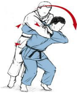
MOROTE SEOI NAGE