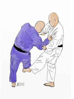
DE ASHI HARAI (escoba baja)