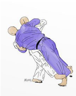
SASAE TSURI KOMI ASHI (zancadilla)