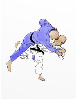
UCHI MATA (superman)