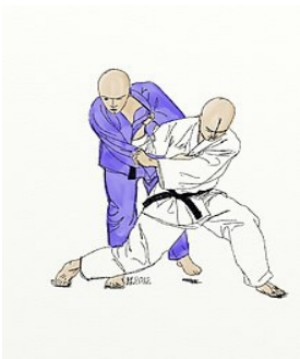
TAI OTOSHI (caída del gran valle)