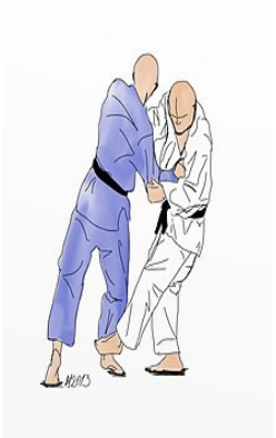
KO SOTO GARI